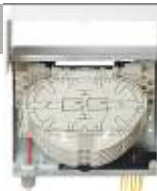
OPTOPOINT THREE 185 x 160 x 75 mm (BxHxT)

OPTOPOINT THREE - kleiner BEP für fünf bzw. elf Wohneinheiten