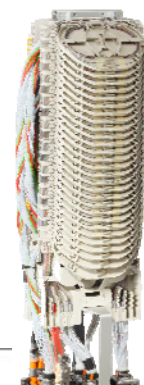
MUFFE UCNCP MAX verschiedene Grössen bis zu 2 x 60 Kassetten