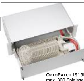
OPTOPATCH 19" 3HE max. 360 Spleisse

19" OPTOPATCH - mit Steckern oder zum spleissen